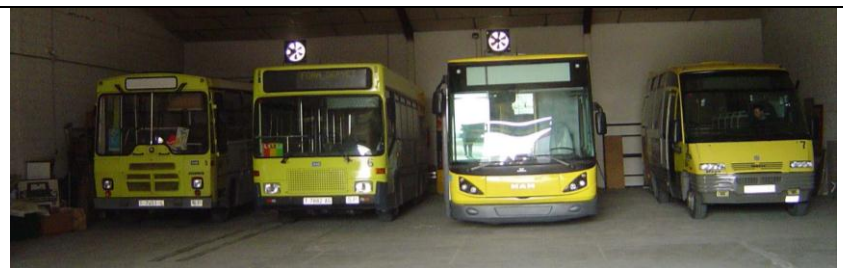
Buses_(Toda la Flota)_2006-02(XF).jpg