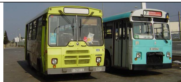
Bus_16 (con Pareja Valls)_2006-02(XF).jpg

El 4 de febrero de 2006 ARCA organizó una visita a Tarragona y Valls